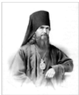
Свт. Феофан Затворник [23 янв., 29 июня н.ст.]

Исцелены десять прокаженных, а благодарить Господа пришел только один.